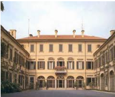
Villa Berlusconi Arcore

Nel 1973, con rogito che verrà effettuato solamente nel 1980, la marchesina Anna Maria Casati Stampa, grazie ai buoni uffici di Cesare Previti che ne avrebbe dovuto difendere gli interessi, vende ad una delle società Fininvest di Silvio Berlusconi, la IDRA, la villa di Arcore di 2.500 mq con 250.000 mq di terreni per la somma di LIRE 500 milioni ..!!