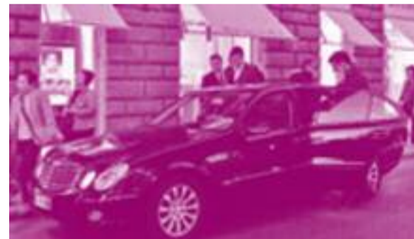
Dalla Fao a Bulgari in mercedes