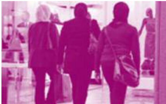
Borse di lusso per le signore della Fao