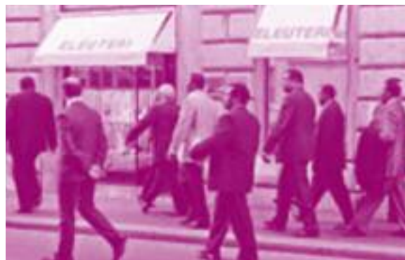
Le delegazioni della Fao fanno shopping

biamo fornito i numeri dei bilanci della Fao e della sproporzione (ricorriamo all'eufemismo!) tra quanto dilapidato dalle migliaia di funzionari e dipendenti «in rappresentanza» a fronte di quanto pervenuto come sussidio, per favorirne la crescita, al Terzo Mondo.