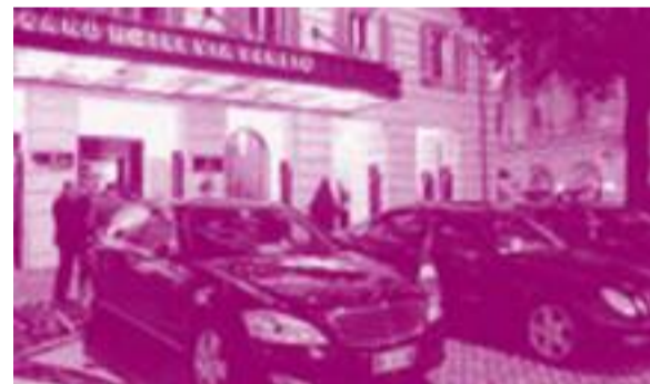
Hotel di lusso per i leader del terzo mondo

Quando la Fao occupa la scena se ne vedono di tutti i colori. E non solo in senso pigmento-cromatico. Toni patetici che si alternano all'arroganza supponente di vecchi e giovani «sfruttatori» dei loro popoli. Funzionari superpagati di un organismo superparassitario che tengono sermoni moralistici sulla necessità che gli Stati aumentino i loro aiuti per la greppia in cui stramangiano da decenni. Persino il sanguinario Mugabe (che da più di trenta anni è uno dei maggiori affamatori d'Africa) indossa i panni dell'inquisitore attaccando i Paesi occidentali per la loro avarizia nell'elargire contributi ai Paesi poveri. Che la Fao rappresenti uno dei più ignobili carrozzoni inventati dalla demagogia liberal-comunista e da certo cattolicesimo progressista è cosa nota: la politica degli «aiuti» al Terzo Mondo costituisce da sempre un modo criminale di «puntellare regimi sanguinari e dittatorelli socialisti» favorendo oltretutto la dilatazione di apparati burocratici che pesano sulle economie dei Paesi poveri. Più volte ab-