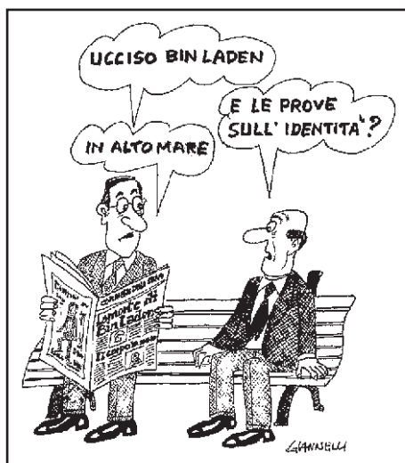
(dal “Corriere della Sera”)