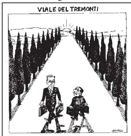
(dal "Corriere della Sera")

Ha detto di voler fare una Commissione d'inchiesta sulla Magistratura, colpevole di non rinunciare ad indagare sui lati oscuri del suo passato e della sua ricchezza, cosa inconcepibile negli altri Paesi dove non si permetterebbe mai ad un "indagato" di fare una legge contro coloro che lo stanno indagando.