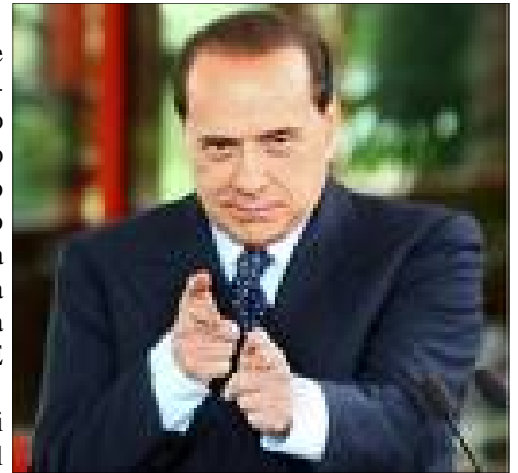
Silvio Berlusconi, "premier" dell'Italia "nata dalla liberazione", cioè dalle baionette degli invasori angloamericani

Risponde Alessandro Mezzano con un recentissimo scritto, che propongo: <Solo il Fascismo, con il pensiero di Benito Mussolini, che fu senza dubbio alcuno, oltre che l'unico vero rivoluzionario del XX° Secolo il suo più grande statista, era riuscito a spazzare le ragnatele della politica lanciando finalmente