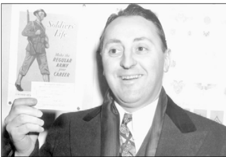
Charles Poletti che fu a capo del governo militare "alleato" in Italia

Nella confusione seguita all'invasione e alla caduta del Fascismo, la mafia vide l'opportunità di riorganizzare il vecchio potere, di insinuarsi nel vuoto del nuovo, raccogliendo i frutti della collaborazione con gli alleati. Molti suoi uomini noti ebbero cariche importanti: per esempio, un mafioso celeberrimo, don Calogero Vizzini, fu nominato da un tenente americano sindaco di Villalba; nella cerimonia d'insediamento, fu salutato da grida di "Viva la mafia!". Vito Genovese, benché ancora ricercato dalla polizia degli Stati Uniti in rapporto a molti delitti, compreso l'omicidio, divenne il braccio destro indigeno del governatore Poletti, ma una banda ai suoi