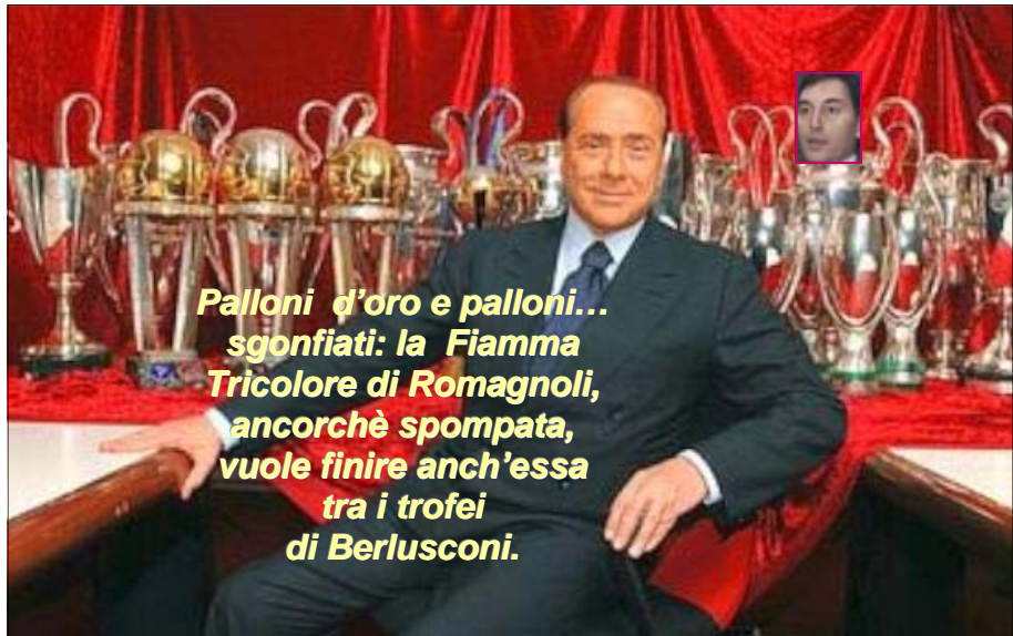
Palloni d'oro e palloni... sgonfiati: la Fiamma Tricolore di Romagnoli, ancorchè spompata, vuole finire anch'essa tra i trofei di Berlusconi.

La Fiamma torinese vuole allearsi con chi si appoggia alla camorra Il congresso provinciale di Torino della Fiamma Tricolore ha stabilito di appoggiare la linea di subordinazione al Pdl in sintonia con l'azione del segretario nazionale Luca Romagnoli. Chi si allea con il PdL, oltretutto da posizioni di estrema debolezza organizzativa ed elettorale, non solo rinuncia ad essere opposizione ma si allea con la camorra e la mafia . Triste fine di chi evidentemente ha dimenticato le proprie radici.